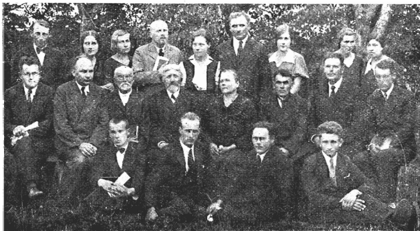
Brahlu draudseš 1. rajona konferenzeš delegati un Wijzeema nodalaš dubultkwarteta dalibneeki sch. g. 9. septembri Kalejinu mahjaš dahrijā.

Behz tam pl. 3 konferenzeš flehšfchanaš deewtalpojumš. Serodaš tā weefiš wirštehtinfch R. B e h r s i n f c h un Jaunpeebalgas draudseš palihgmahzitajš R. O s o l i n f c h. Behz plašhā deewtalpojuma weefmihtlīgā mahjaš mahte Z i p a r a h d s e fneedša atbraufufcheem weefeem daubš