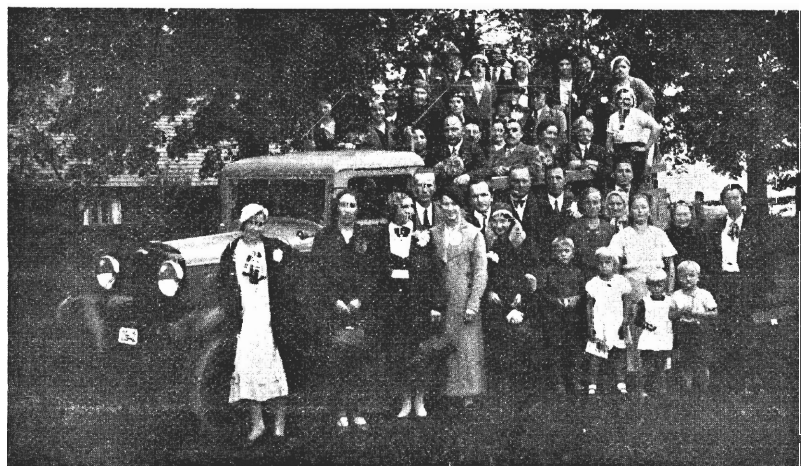
Brahlu draudses darba grupa bee Brenquļu Daudschu jāeeschanas nama. kopā ar laipno mahjas tehwu br. Pauwartu un wina ģimēni.