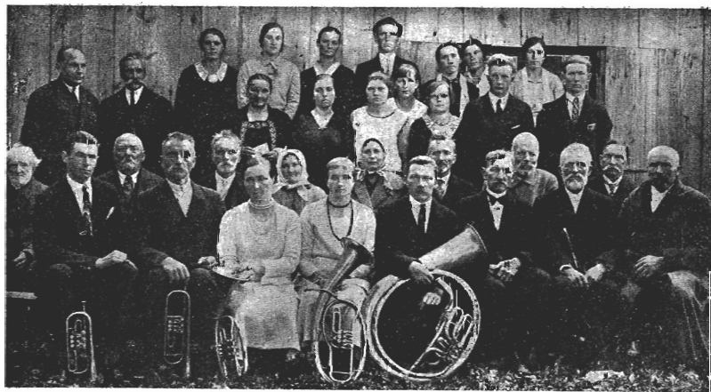
Ģatartas Brāhlu draudzes jaunatnes foris un orķestris šihds ar weceem, kas eradushees uf konferenži 6. septembri 1931. gadā, Ģatartas Kalna-Wilumos.