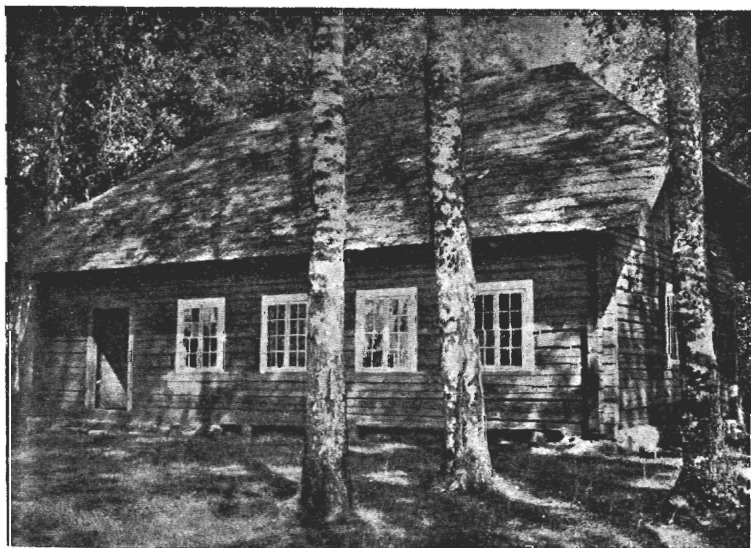
Brahlu draudses luhģchanas nams — Spalwās — Wezgulbenē, turich pirmais peeschirts par ihpašchumu b-bai — Latv. Ev. Brahlu draudsei.