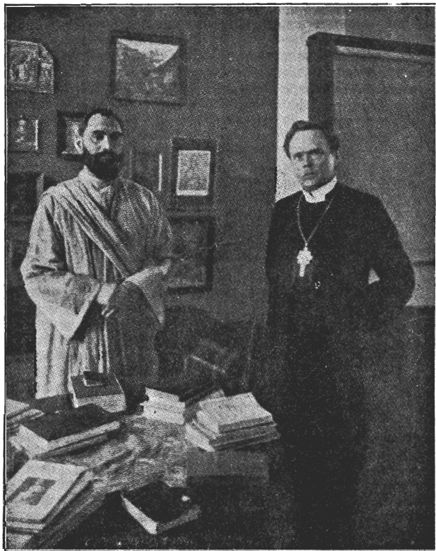
Ĝadu=Ĝundars=Ĝinga un Ĝweedriřaš ew. lut. draudřeš arķibifřapš Ĝöderblomš.

Ło pařřu meeru winřř řařuta, řad winřř jau minetâ pilřehta pilnigi řailš bij bluř eēřřořtoiš un dehřeš iřřuřza wina ařiniš. „Řirmajâ pušřtundâ eš domaju, řa taš ir ĝruhtš pařřbaudijumš, bet drihř mani pařřnehma tiř brihniřřřiř meers, řa eš řawaš meeřřiřaš řařpeš tiřřo řařutu. Eš newaru dřeedat, bet řřai ařumirřli eš newareřu řluřet; ĝruhtatajâ wajařřanaš brihdi eš řahfu dřeedat řlaiřtaš řlawaš dřeeřřmaš. Laudiš man řařija: „Lai nu tawš řehniřř řewi ĝlahbi!“ — Eš at-bildeju: „Zaur wina řehřlařřibu eš eřmu brihřš; man ir dwehřleš meers, řura řumš truhřřt. Tad mani mořitaji atřina, řa eš teeřřam řuhtoš laimigš“. Debefš meers ir řundar=řinga dřihweš řen-