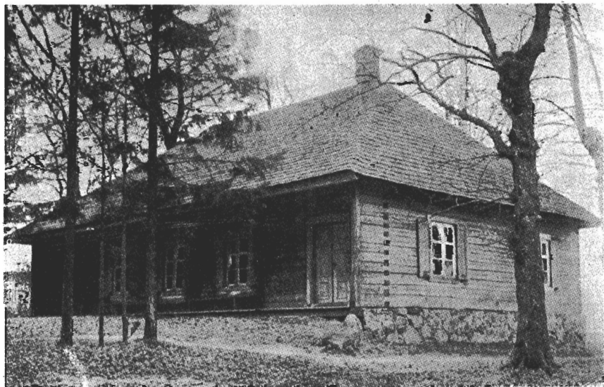
Šmiltenes Mazulu ſaeefchanaš namaš.